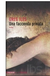
G. Iles, Una faccenda privata , Milano, Piemme.