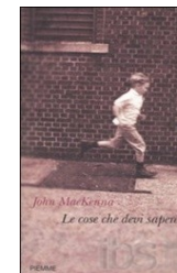
J. MacKenna, Le cose che devi sapere , Milano, Piemme.