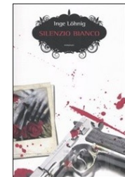
I. Löhnig, Silenzio bianco , Roma, Elliot.