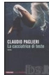
C. Paglieri, La cacciatrice di teste , Milano, Piemme.