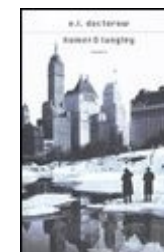
E. L., Doctorow, Homer & Langley , Milano, Mondaori