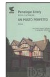
P. Lively, Un posto perfetto , Parma, Guanda.