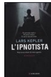
L. Kepler, L'ipnotista , Milano, Longanesi.

Settimana dal 27 febbraio al 6 marzo 2010