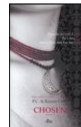
PC & K. Cast, Chosen , Milano, Nord.